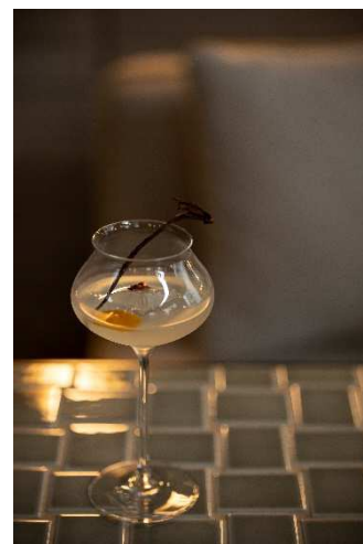
コラボレーションカクテル

内容 : モルトンブラウンの香り「ネオンアンバー」のキーとなるアロマをカクテルグラスに閉じ込めました。「バニラ」「オレンジ」「ピンクペッパー」「シダーウッド」の4つの要素が織りなすスパイシーな温もりとその香りを堪能する、奥深い一杯です。様々なボタニカルのがみが渾然一体となり、口の中に華やかな余韻が広がります。