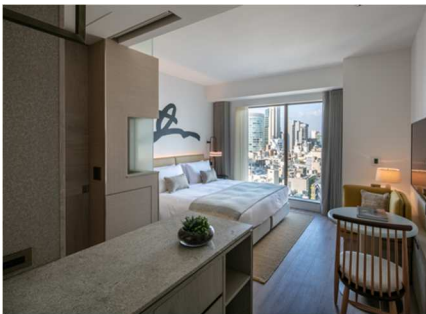
必要な機能がそろった客室 Studio (25㎡)