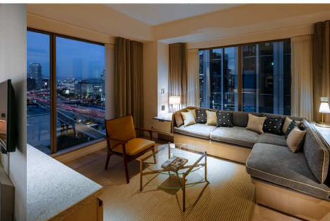
大阪の町が一望できる Suite (57㎡)