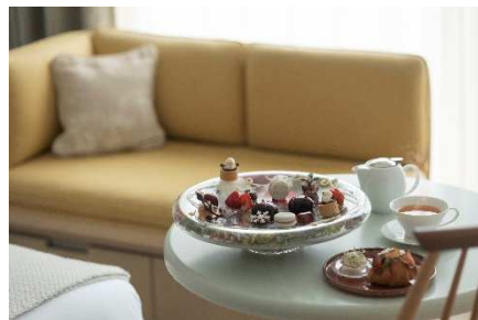
宿泊プランイメージ