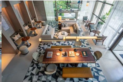
ゆったりとしたゲストラウンジ