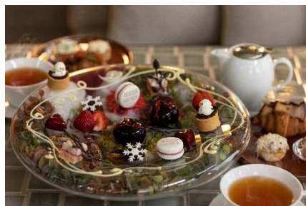
アフタヌーンティープレート

内容 : モルトンブラウンの香り「ネオンアンバー」の持つ甘さと情熱をイメージしたアフタヌーンティープレートをご用意。全10種類のスイーツやセイボリーの華やかなプレートがモルトンブラウンの世界観を演出します。6種類のティーフリーフローと、モルトンブラウンのシャワージェル付き。