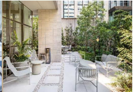
緑に囲まれた1Fのガーデン